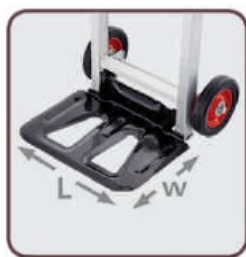
L-355 mm; W-240 mm