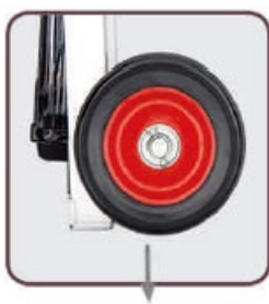
Oceľ + guma; priemer 150 mm